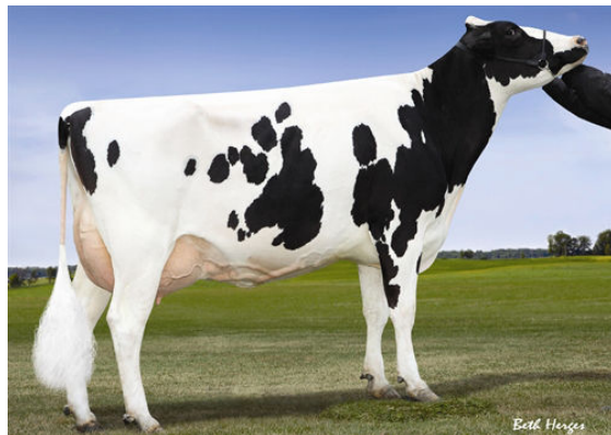
LADYS-MANOR PL SHAKIRA Dam